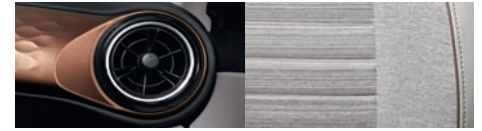
Gris / Café